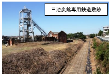
三池炭鉱専用鉄道敷跡

宮原坑や万田坑などの各坑口と三池港をつないだ鉄道敷跡。レールは撤去されているが枕木が残る。宮原坑で見学できる。