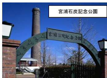
宮浦石炭記念公園