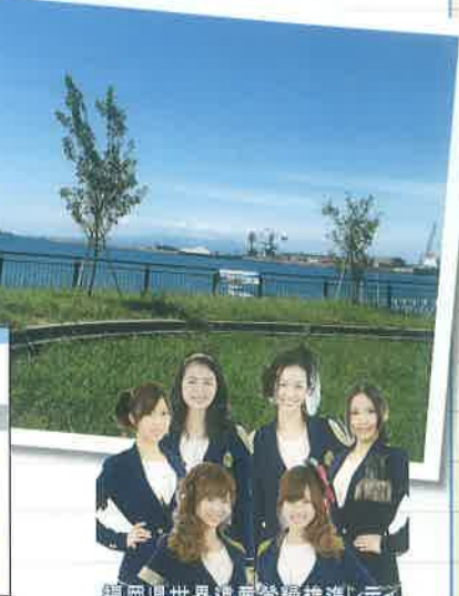
福岡県世界遺産登録推進レディ